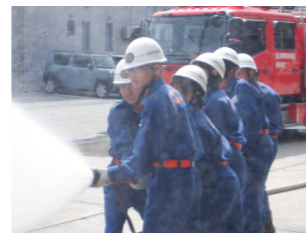
《社会に学ぶ「14歳の挑戦」(2年)》