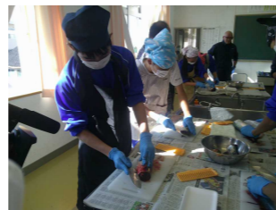
《魚のさばき方教室》