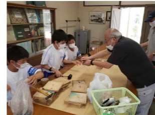
《社会に学ぶ「14歳の挑戦」(2年)》